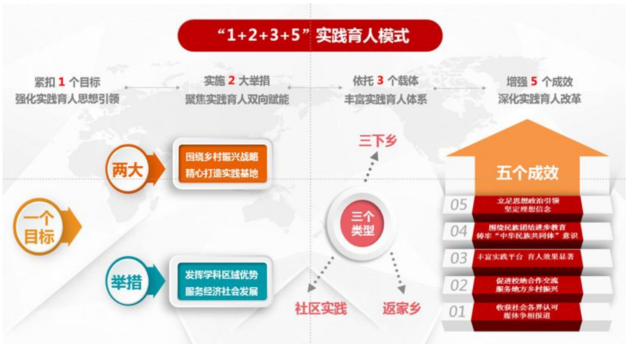
图2 学校“1+2+3+5”社会实践模式

学校获评全国“三下乡”社会实践优秀组织单位、1名学生被评为全国大学生“返家乡”社会实践活动优秀个人，9支实践团队入选国家级社会实践展示活动，42个集体和个人获得省级社会实践荣誉，累计在中国青年网、人民网等媒体发布新闻23条，推普助力乡村振兴专项社会实践团队荣获全国优秀团队。